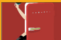
Simplicissimus Martxoak 15