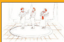
Hansel eta Gretel Otsailak 8