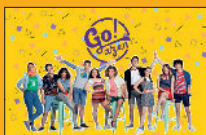
Goazen 6.0 Urtarrilak 5