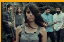
Nøgen Urtarrilak 25

ANTZERKIA HAUR ANTZERKIA ZARZUELA MUSIKA