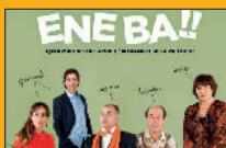
Ene ba! Otsailak 23