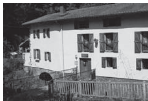
› Barrenazar baserria (Epelearen ondoan)