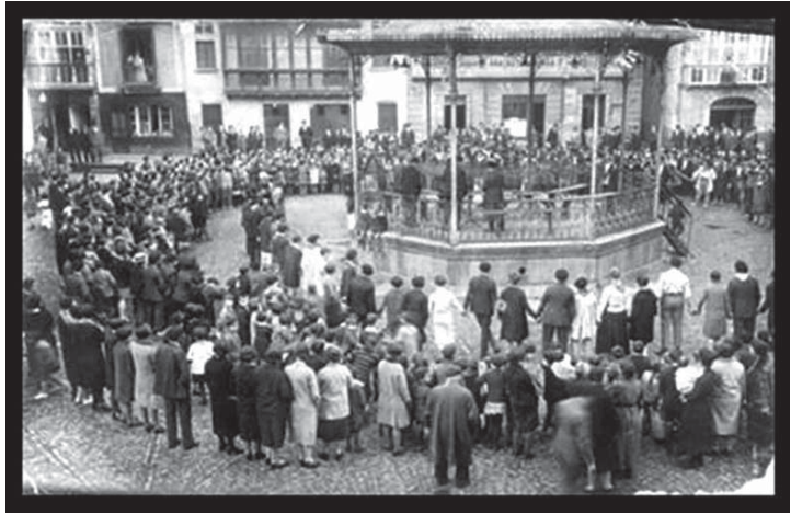
› Plazako musika kioskoa. Aurrekoa dantzaten 1928an

2020.urtean Covid 19ak eragindako pandemiak denok etxera sartu gintuen eta birusari aurre egiteko geure bizimodua zeharo aldatu zitzaigun. Etxean bizi, ikasi, jolastu eta sentitu egin dugu. Berrogeialdia, konfinamendua, deseskalada, txertoa... hitzak ikasi eta erabili ditugu eta aro ahaztezina bizitzen ari gara, bukatuko den esperoan, gure etxeetan zein kaleetan lagunenez eta familiaz elkarbizitzen eta jolasten.