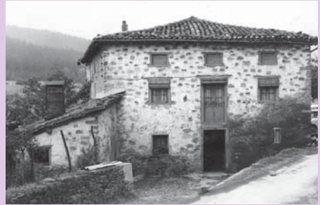
› Markulete baserria