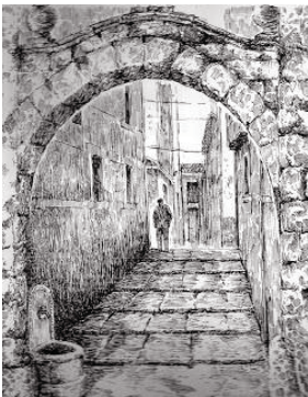
› Olarte atea,

"Vencedora espada de Mondragon tu acero y en Toledo templada".