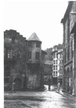
› Gerraenea jauregia