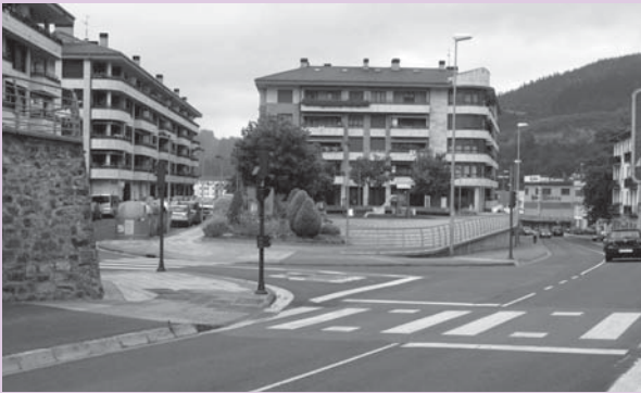
› Legarra baserria zegoen tokia