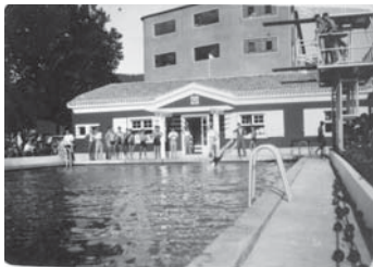
› Zerrajerako igeritokia