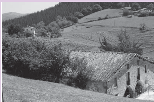
› Bidasoro, Artasia. Hortik ezkerretara Magalbe.