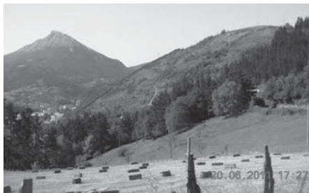
› Larragain Bedoñatik