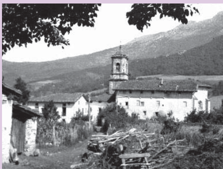
› Garagartza 1942