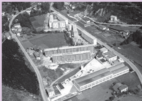
› “ San Andres, hainbat baserri desgertuta”