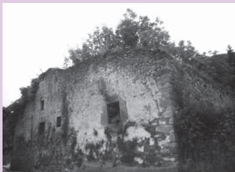
› San Kristobal gaur egun