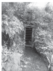
› Urzulo (Udalatx barrukoa)