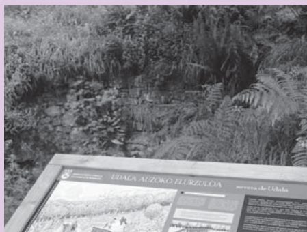
› Udalako elurzuloa (Axpe)