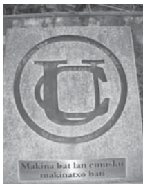
› Union Zerrajerako oroiharria

Langileentzako etxeak, Aprendizen eskola, eliza bat, Hetruc (Babes sozialeko elkartea), Tuberkulosiaren kontrako zentroa, ekonomatoak, jantokiak eta kirol instalazioak sortu zituen. Kirol instalazioei dagokionez, futbol zelai bat egin zuten eta futbol ekipo bat sortu. 1948an pizsina bat eraiki zuten. Arrasateko bakarra zen baina bakarrik gizonen onartzen zitzaizen sarrera. 1977an Udal pizsinak zabaldukoan, 1978an itxi egin zituen bere instalazioak.