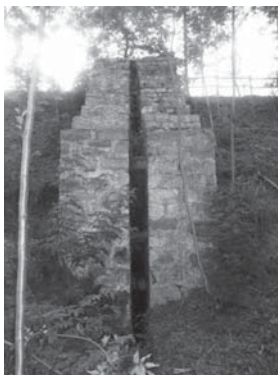
› Mineral garbitokia