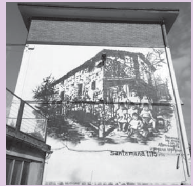
› Santamaña baserriaren horma irudia