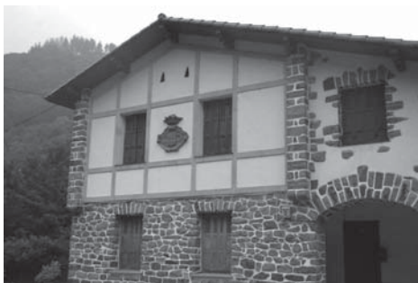
› Aduana ( Portazgo)