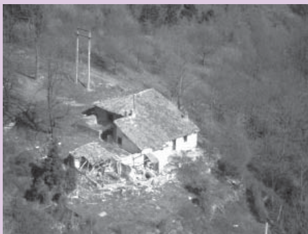
› Antzinako San Kristobal baserria