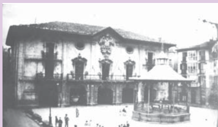
› Antzinako musika kioskoa