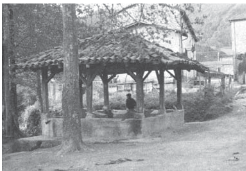
› Musakolako garbitokia