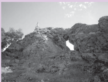
› Santa Agedatx