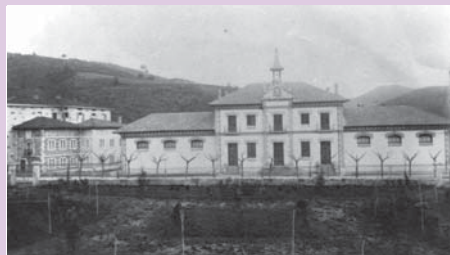
› Biteri eskolak (ezkerrean Garibai etxea)