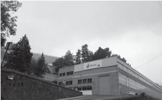
› Alecoop lantegia