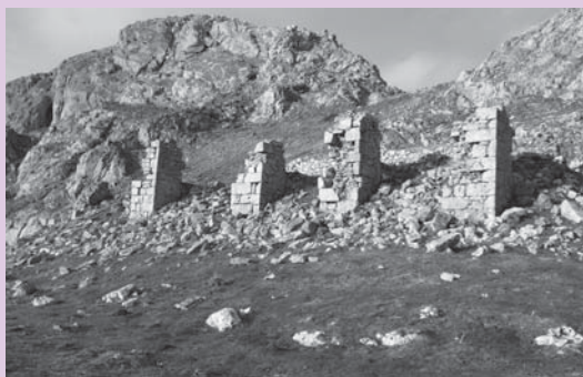
› Udalatx (Igoera eta jaitsiera Txukurillotik)