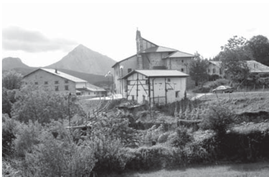
› Udala auzoa

Entzun al duzu inoiz abadearen txakurren zaunkarik?