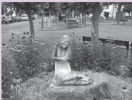
› Garagartzako plaza