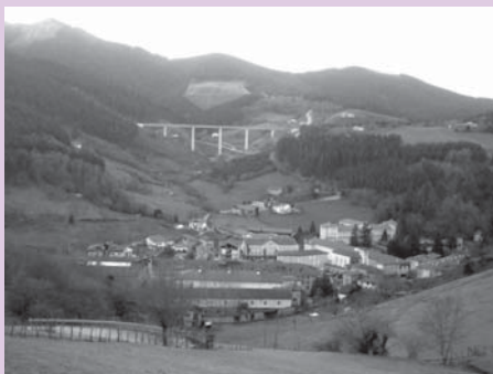
› Gesalibar auzoa