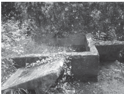
› Meatzerrekako garbitokia