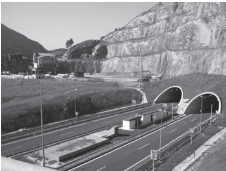
› San Josepeko harrobia (2011)

Harrobiaren ezkerrean, Kurtzetxikiko bidean, aiurrian, San Josepe Nuestra Señora Blankaren ermita dago. Urte askotan elizaren inguruan erromeria jendetsuak egiten ziren.