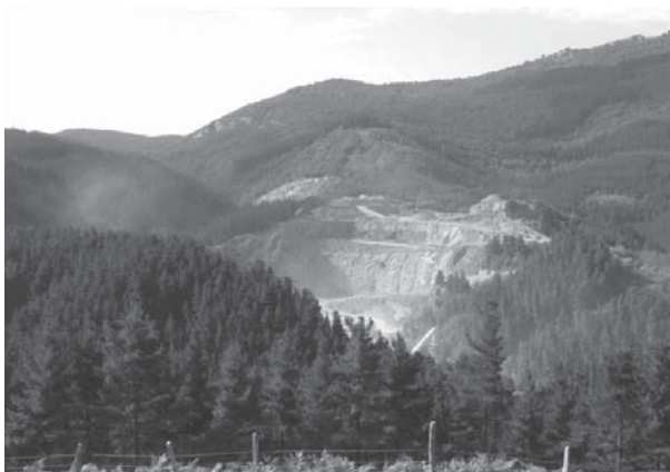
› Kobate harrobia