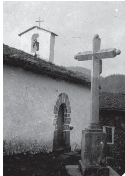
› San Josepe ermita (Oianguren)