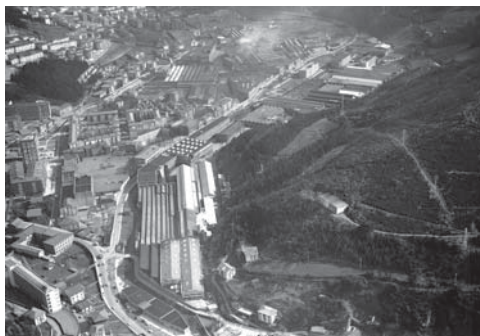
› Union Zerrajera (Joan zen mendearen 70.ko hamarkada)