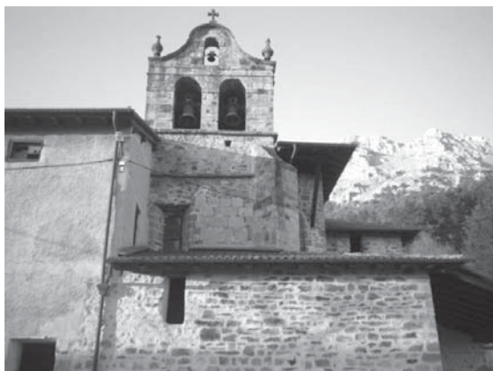
› Udalako eliza eta Udalatx