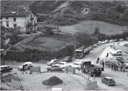
› Larrea baserria