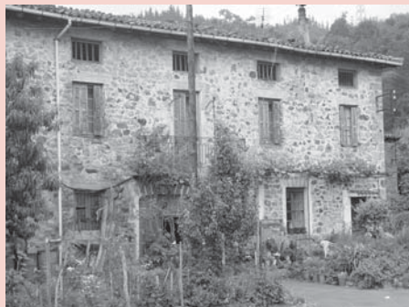
› Osinagaazpikoa baserria