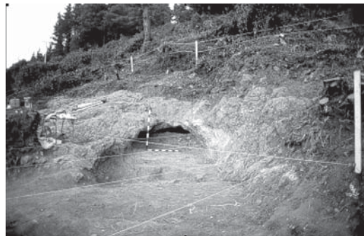
› Labeko koba