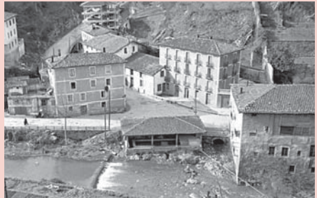
› Olaoste errota: Bizkai etorbidean zegoen.