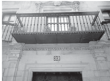
› Artazubiaga jauregia.