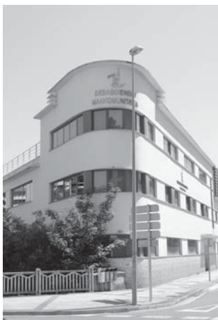
› Debagoieneko manko-munitatearen egoitza.

Lantegia zegoen gaur egun Debagoieneko Mankomunitatea, Lanbide Has-tapena, Udaltzaingoa, Txatxilipurdi elkarte eta Ereindajan dauden eraikinean.