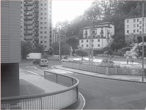
› Arrasate errota: Errebuelta kalearen aldean.