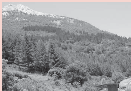
› Udalatx Meatzerrekatik