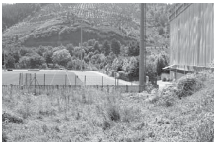
› Antoniña (Antoña) baserria izan zen tokia.