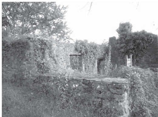
› Baserriaren aiurriak