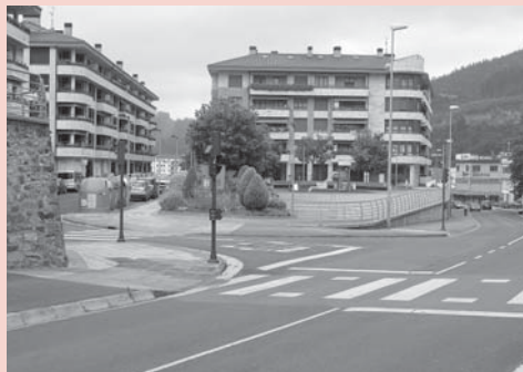
› Legarra plaza