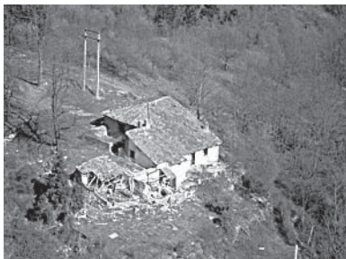
› Antzinako San Kristobal baserria

“San Kristobal, herriko gaindegi historikoa.”