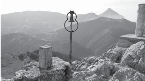
› Murugaineko gailurra

Murugainen ahaleginean hiru herritako ondare historikoa berreskuratzen.