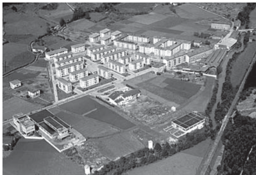
› San Antolingo etxeak (goiko ezker aldean).