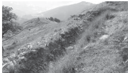
› Murugaineko lubakiak