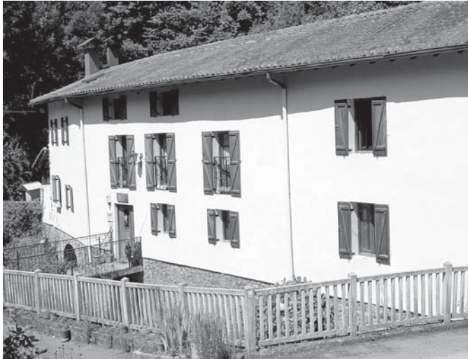
› Barrenazar (Musakola)

Arrasate osatzen daue erdiguniek ta bederatzzi auzok, ta bakotxak bere nortasune dauko.