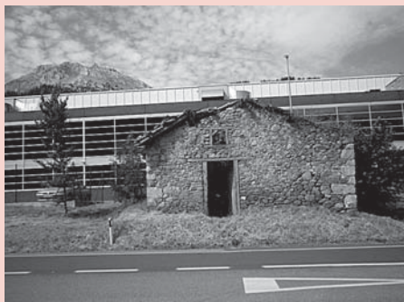
› Barrenatxo, gaur. Atzean, Polmetasa lantegia