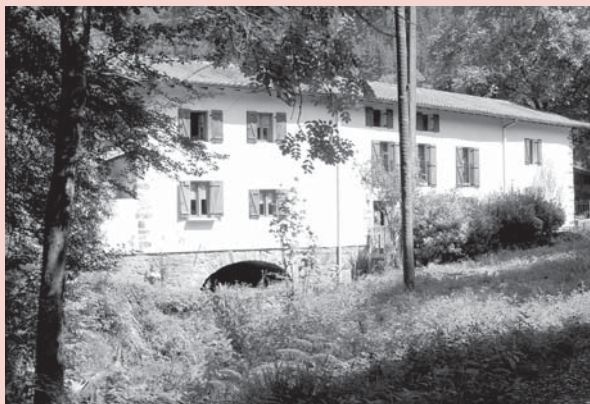
› Barrenazar baserria.