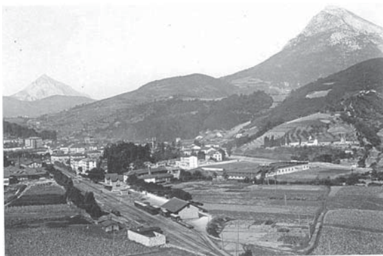
› Antzinako Zalduspe.