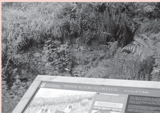
› Udalako Elurzuloa