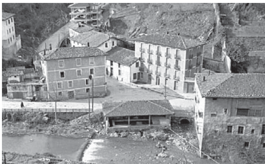
› Zarugaldeko garbitokia