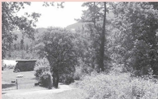
› Lete etxea