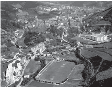
› Uribarri auzoko Uribar-zubi zelaia

Futbola, atletismoa, eskola ... auzoaren hauspoa eta bizipoza.