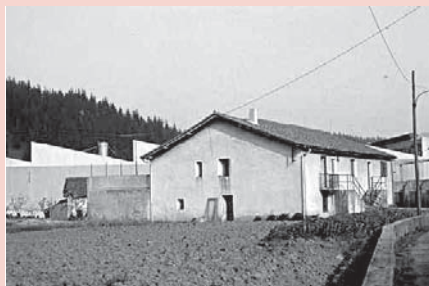
› Murriena (Babilonia)