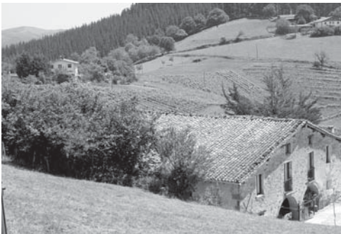
› Goiko ezkerrean, Artazubiaga base- rria.

Gaur ezagutzen dugun Artazubiaga jauregia, XVI. mendean eraikia da eta Iturriotz kalean dago. Harlanduz eginiko jauregi horren aurrealdean armarrria ikusiko dugu, gertatutakoaren adierazgarri, ate gainean latinez idatzitako esaldiak honela dio: "Pro nostris generis libertate combusta" "Gure leinuaren askatasunagatik errea." Ateburuan, latinez beste inskripzio bat agertzen da; hauxe: "Solus labor parit virtuten, sola virtus parit honorem" (lanaren bitartez bertutea lortzen da eta bertutearekin ohorea).