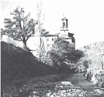
› Garagartzako eliza