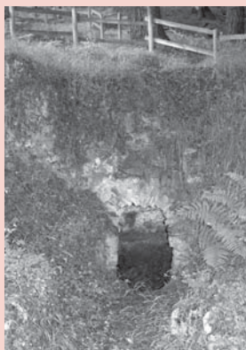
› Gazeaga (Obiaga)