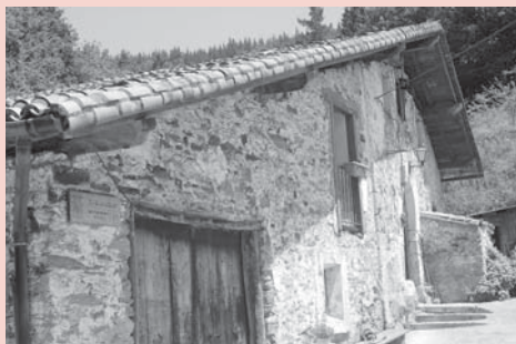
› Askasibar baserria