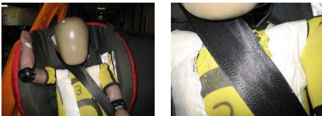
Figura 3: "Brio Zento": rastros de fricción como consecuencia del contacto del cuello con el cinturón del vehículo.