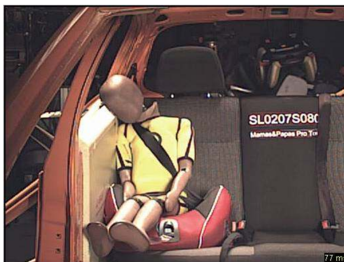
Figura 4: Ejemplo modélico de un alzador sin respaldo: la cabeza del maniquí queda totalmente desprotegida y se golpea fuerte contra las paredes del vehículo.

En la figura 4, se observa que la cabeza del maniquí, sentado sin protección lateral, golpea fuertemente contra el borde superior de las puertas del vehículo. Las cargas resultantes de ello son muy altas. También el tórax se golpea totalmente desprotegido contra las puertas del vehículo. Por eso, estas sillas recibieron la calificación de "muy insatisfactorias" en el choque lateral y, por tanto, también un "muy insatisfactorio" en la evaluación general.