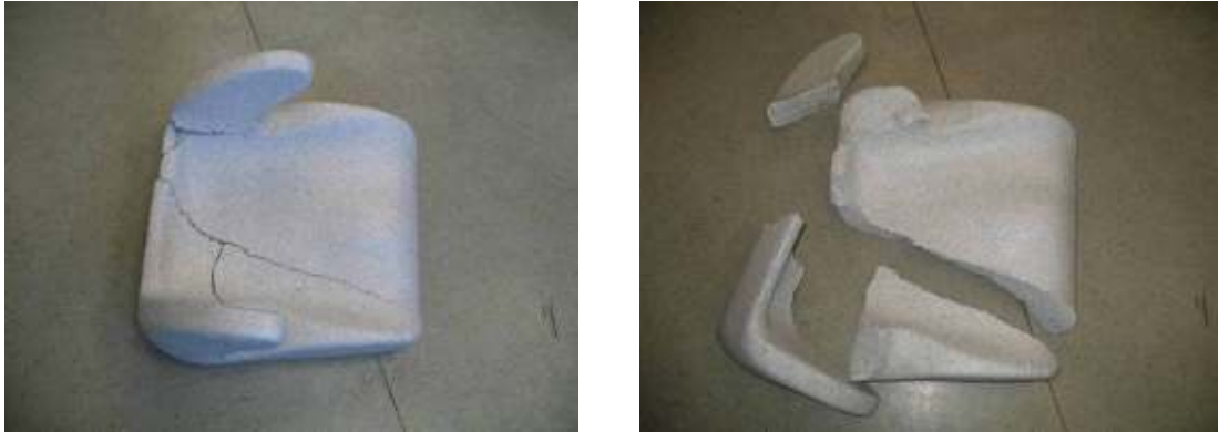
Figura 1: la silla "Little Shield Combi 123" queda rota después del ensayo.