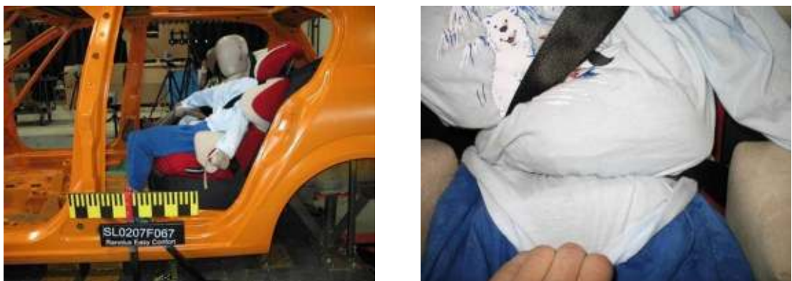
Figura 2: Renolux Easy Comfort: el cinturón de pelvis se desplaza sobre la pelvis y penetra en el abdomen del maniquí.