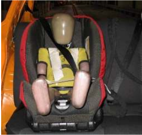
Figura 7: en el SRI Brio Zento, el cinturón de hombro carece de guía y queda demasiado cerca del cuello del maniquí.