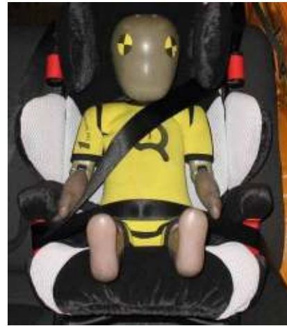
Figura 8: en esta silla se sujeta al dummy con el cinturón de tres puntos. El niño podrá deslizarse fuera del cinturón en el trayecto.

Como el recorrido del cinturón es un criterio importante, si este recorrido es incorrecto, la evaluación de la seguridad podrá conseguir un "insatisfactorio" en el mejor de los casos.