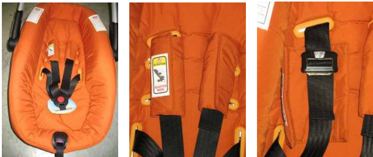
Figura 9: regulador para adaptar la longitud del cinturón (1) y cinturón central (2) en el SRI Jané Matrix Cup

El modelo Jané Matrix Cup sólo consigue un "insatisfactorio". Si se regulan en altura los cinturones de hombro, entonces habrá que adaptar la longitud del sistema completo de cinturones. Esto se realiza por medio de reguladores independientes, que se encuentran debajo del acolchado del respaldo (1 en la figura 9). Si el ajuste no es exacto, el recorrido tensor del cinturón central (2 en la figura 9) no tendrá longitud suficiente como para tensar el sistema de cinturones una vez que éstos se le hayan colocado al niño. Además, es casi imposible quitar los lazos de los cinturones de hombro sin utilizar una herramienta.