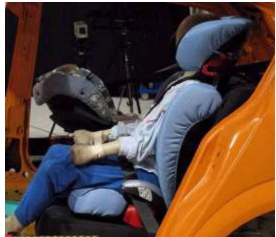
Figura 6: En comparación, una silla con buena guía del cinturón, que retiene el maniquí por encima de los muslos.