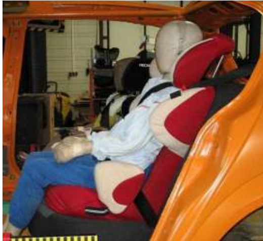
Figura 5: En el SRI Renolux Easy Comfort, el cinturón de pelvis transcurre muy alto sobre el abdomen del maniquí.